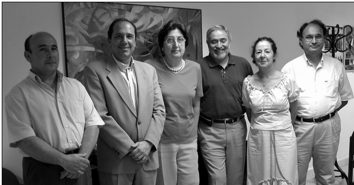
Responsables del Aula Permanente de Formación Abierta de la Universidad de Granada curso 05-06