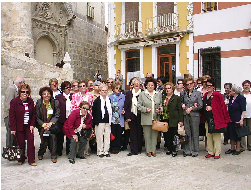
Uno de los grupos asistentes al X Encuentro Provincial