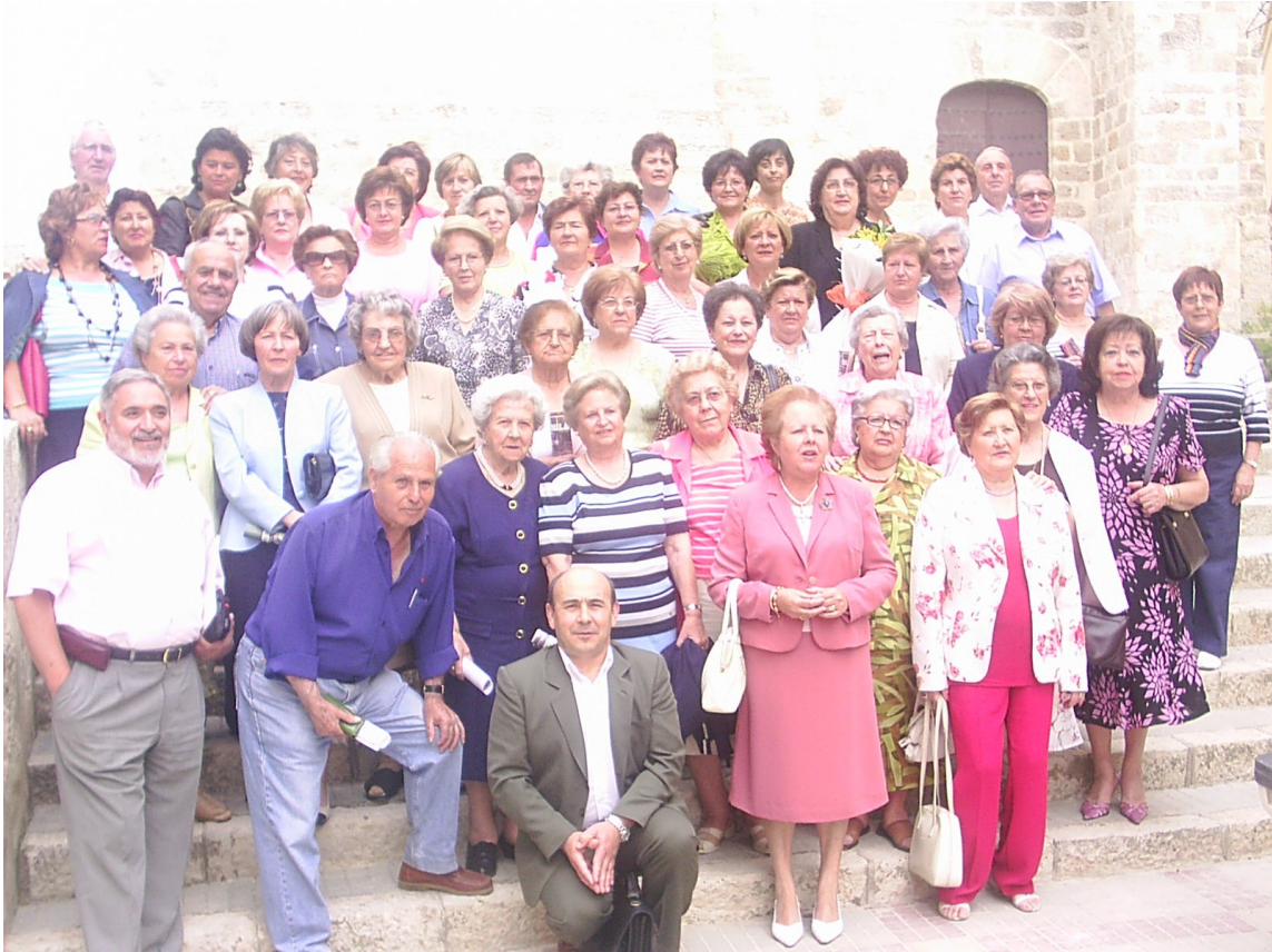
Clausura curso académico 2005/2006