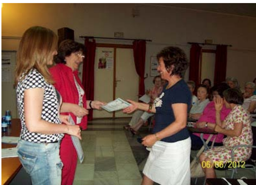
Entrega de diplomas en la Clausura del curso 2011/2012 del Aula Permanente en Baza