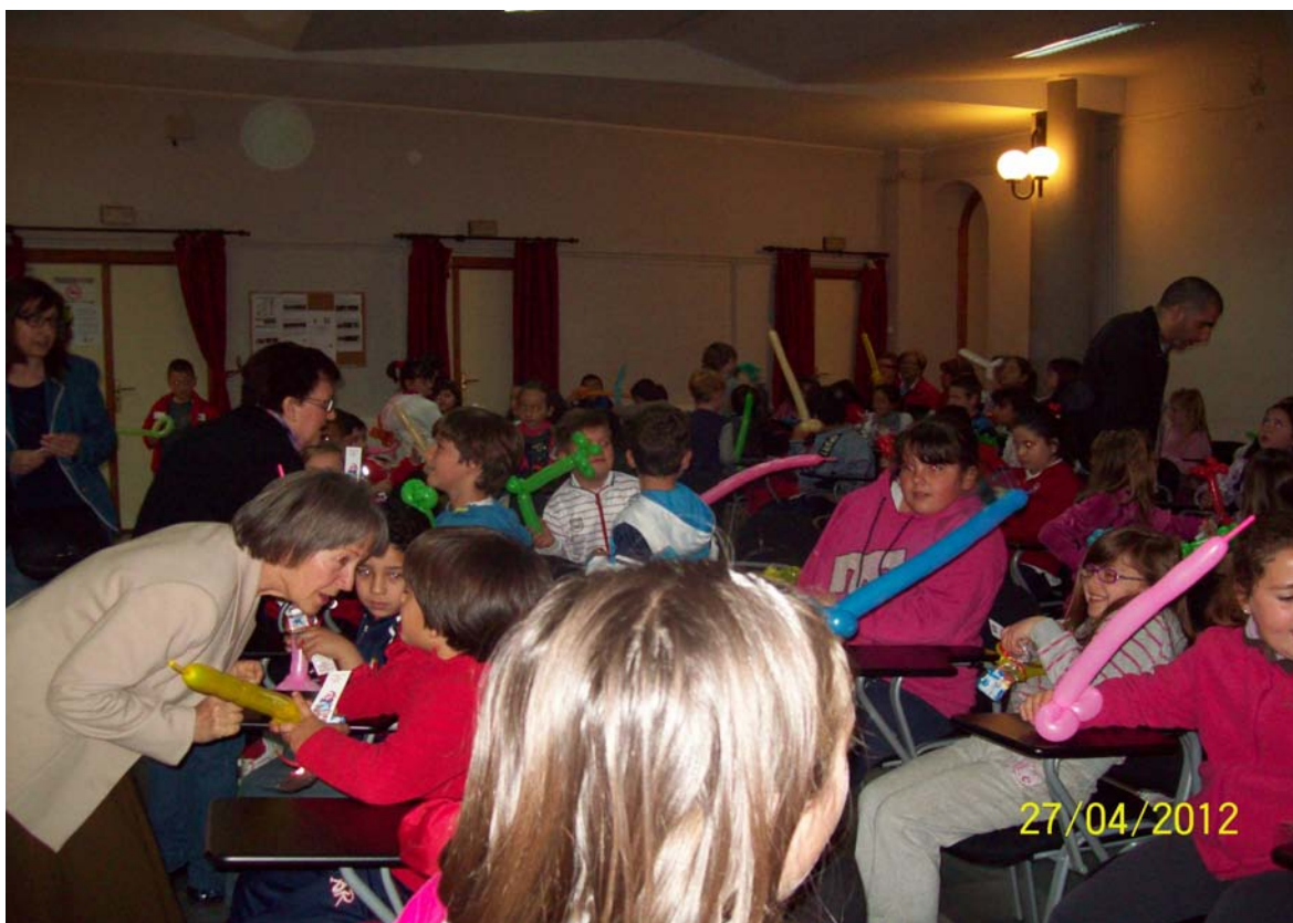
Cuentacuentos Aula Permanente (Baza, “Día del Libro 2012”)