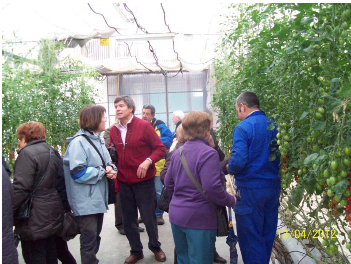
Visita organizada por la asociación para conocer los cultivos hidropónicos (Zújar, abril de 2012)

Blog de la Asociación: http://asociacionbasti.blogspot.com.es/