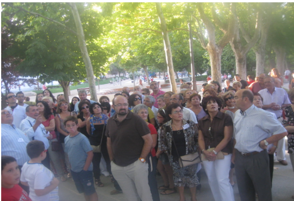
De itinerario con el Aula Permanente (Baza, septiembre de 2011)