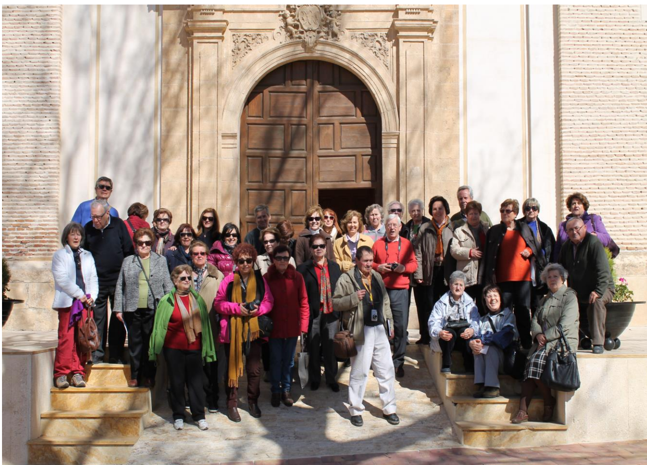
Visita organizada por la asociación para conocer la ruta de los almendros en flor (Oria: portada de Nuestra Señora de las Mercedes, 8 abril de 2013)

Blog de la Asociación: http://asociacionbasti.blogspot.com.es/