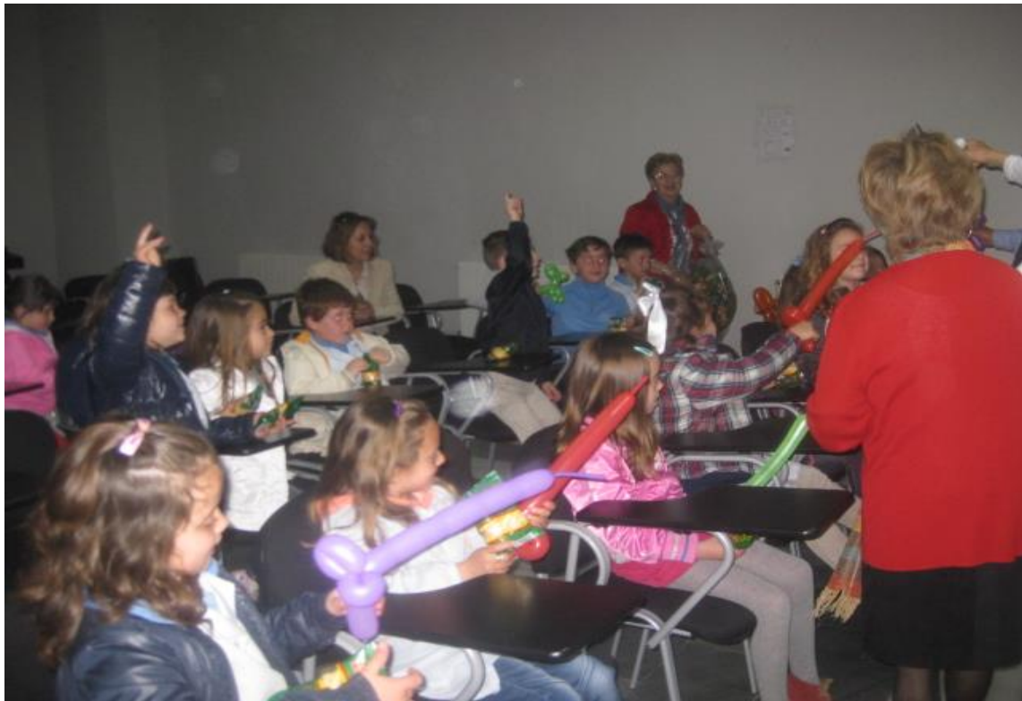
Cuentacuentos Aula Permanente (Baza, "Día del Libro 2013")