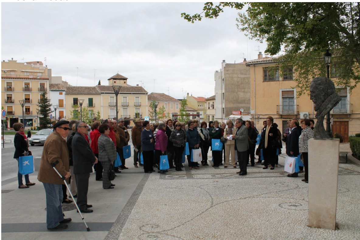
Conoce Baza con el Aula Permanente (25 de abril de 2013)