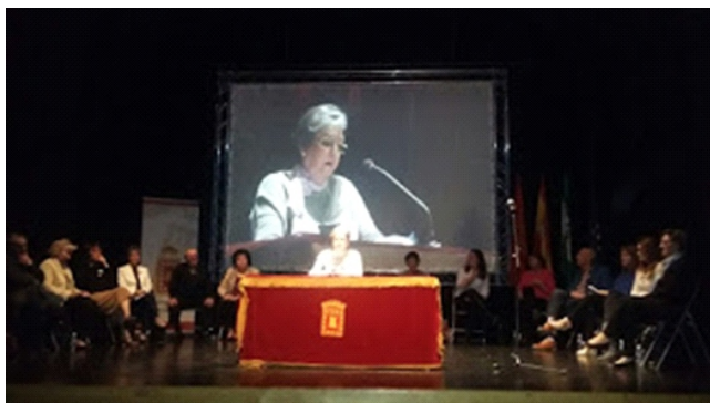
Certamen de cuentos y relatos (abril 2018)

“Certamen de cuentos y relatos” es una actividad en la que los estudiantes del Aula Permanente de Formación Abierta cuentan sus vivencias, pensamientos y experiencias en breves narraciones en colaboración con la Escuela de adultos y la Unidad de Cultura del Ayuntamiento de Baza, para celebrar “El Día del Libro”.