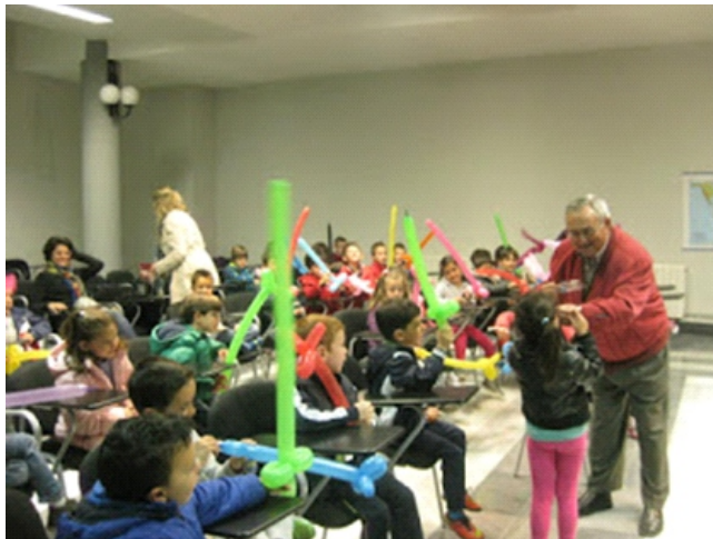
Cuentacuentos Aula Permanente (Baza, “Día del Libro 2018”)

“XIV Cuentacuentos” Realizado por un grupo de estudiantes del Aula Permanente de Formación Abierta y destinado a todos los niños y niñas de cinco años de nuestra localidad, unos 230, en colaboración con los distintos colegios y la Unidad de Cultura del Ayuntamiento de Baza, para celebrar “El Día del Libro”.