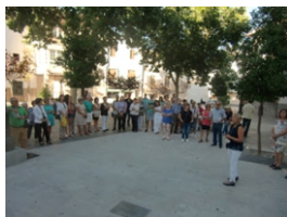
Conoce tu ciudad con el Aula Permanente (Baza, septiembre de 2017)

“Conoce tu ciudad con el Aula Permanente” : XIV Itinerario histórico-artístico por la antigua almedina bastetana, guiado por estudiantes del Aula y destinado al público en general. Este itinerario está incluido en la programación de nuestra feria y fiestas de septiembre, en honor a la Virgen de la Piedad.