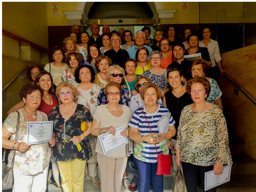
Clausura curso académico 2017/2018