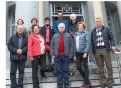
Grupo de Investigación POR UNA SENDA CLARA