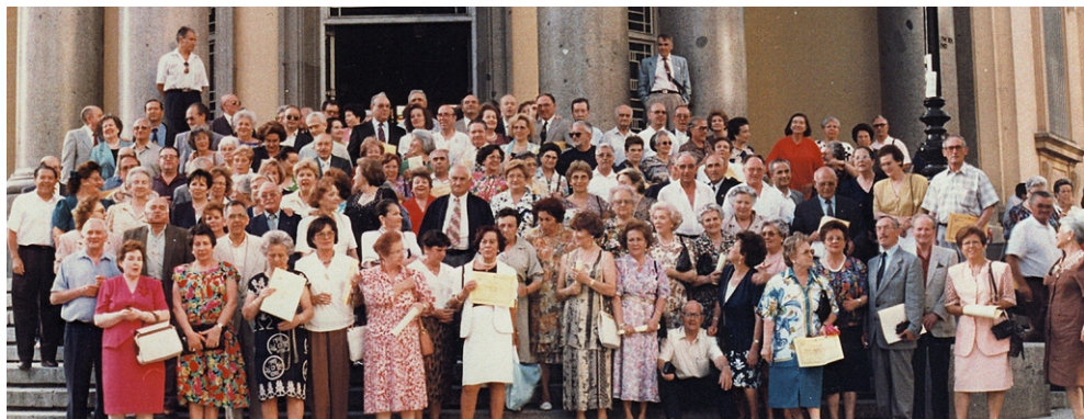
Primera promoción 1994-1995